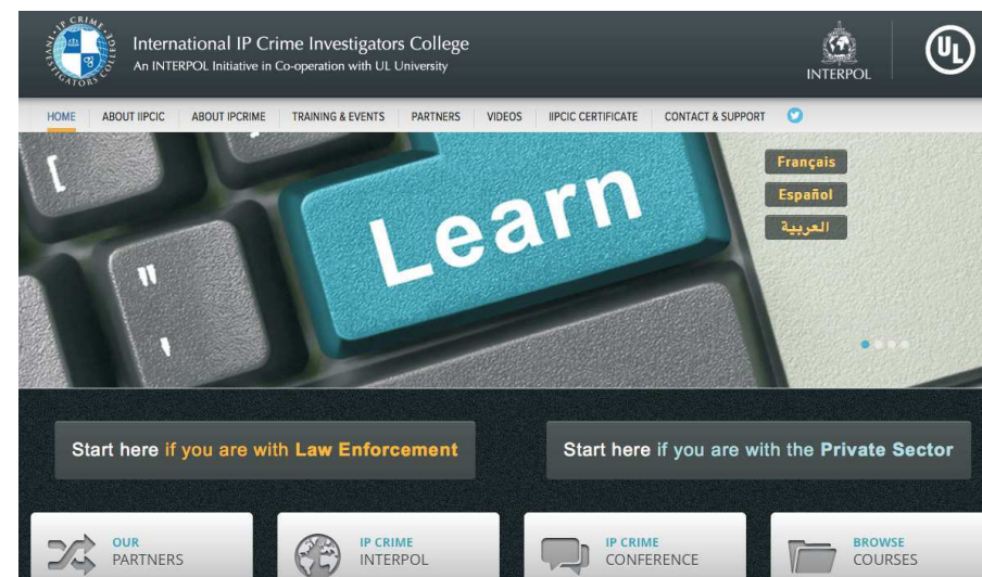
Imaginea 1: Colegiul Internațional de Investigații în Criminalitatea din domeniul PI

Cursul este gratuit pentru inspectorii care activează în domeniul aplicării legii, dar este necesară înregistrarea prin accesarea linkului www.iipcic.org